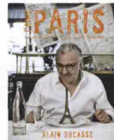
J'aime Paris. La mia Parigi del gusto in 200 indirizzi , di Alain Ducasse, L'ippocampo 2011, 596 + 56 pagine, 29,90 euro.

l'aspirazione di molti e ha confezionato questo ricco volume sulla Parigi dei sapori consigliando ben 200 indirizzi. Con lo stile del reportage fotografico, con tantissime immagini piccole e grandi, sfogliare il libro è come flâner per le strade parigine avendo come navigatore di sottofondo il commento (a volte ironico e divertito, sempre preciso e competente) dello chef francese, monegasco d'adozione, che suggerisce solo posti da lui conosciuti e provati. E una volta a Parigi, non ci saranno dubbi su dove gustare un delicato pâté di fegato di rana pescatrice o i ravioli di foie gras d'anatra ai tartufi, dove mangiare dolci golosi o bere un caffè turco (al Café Maure, a sinistra ), dove assaporare o acquistare la miglior cucina regionale francese, senza girare l'Esagono intero, ma limitandosi a una corsa in metrò. Certo, il ponderoso volume si presta più a una consultazione preventiva domestica o in albergo che a stare nella tasca del turista preso dal trekking urbano-gastronomico. Ma Ducasse ha ovviato all'inconveniente: un agile fascicolo estraibile di 56 pagine riporta tutte le segnalazioni del libro e il relativo commento, aggiungendo arrondissement , orari, indirizzo, telefono e sito Internet. Alla fine, indici vari (alfabetico, per arrondissement e per tipologia) chiudono il cerchio magico della Parigi del gusto firmata Ducasse. Che, a quel punto, non avrà più segreti.