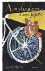
Amsterdam è una farfalla , di Marino Magliani, Ediciclo 2011, 219 pagine, 13 euro.

Marino Magliani, scrittore e traduttore, vive da anni sulla costa olandese. In questo libro, da leggere come un romanzo, racconta Amsterdam vista dal sellino della bici: la storia, le architetture, i canali. Ma anche la metropolitana e i cimiteri delle biciclette.