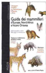
Guida dei mammiferi d'Europa, Nord Africa e Vicino Oriente , Emmebi 2011, 272 pagine, 29 euro.

A parte i cetacei, di cui non si parla, tutti i mammiferi d'Europa e dei Paesi che si affacciano sul Mediterraneo sono trattati in questa guida. Con 600 illustrazioni e 400 mappe di distribuzione, un volume prezioso per naturalisti appassionati.